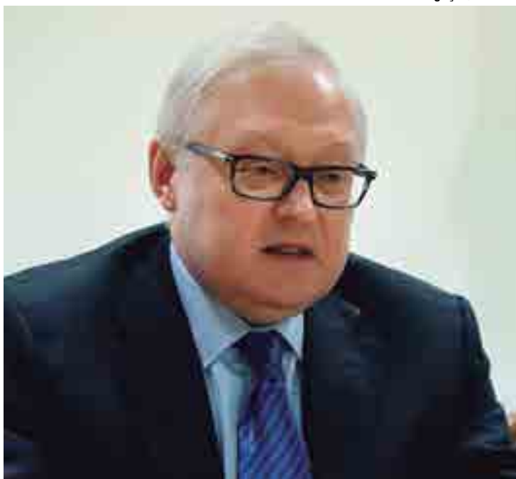
Sergei Ryabkov: há décadas os EUA interferem em assuntos de outros estados

prever que as tentativas de influir na situação, de prejudicar a estabilidade desde dentro, não diminuirão conforme as eleições presidenciais se aproximam. [Ao contrário] irão aumentar. Devemos estar preparados para enfrentar esta situação”, ressaltou Ryabkov.