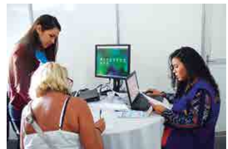
Sexto mutirão da empresa está acontecendo no Ponto de Cem Réis em JP

O coordenador comercial da Energisa, afirmou que a empresa entende que essas famílias estão em débito com a empresa por conta da crise, ou algum outro motivo e convocou através do TJ, cerca de 30 mil clientes para compa-