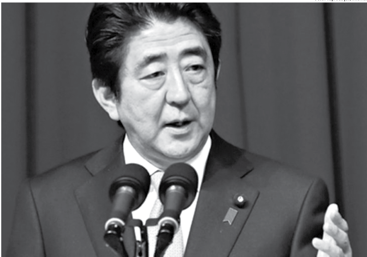
O premiê Shinzo Abe anunciou um plano econômico de R$ 55,7 bilhões que seria financiado com o aumento do imposto sobre o valor agregado (IVA)

Com a convocação de eleições aproximadamente um ano antes do previsto, Abe pode tirar proveito do notável aumento do apoio