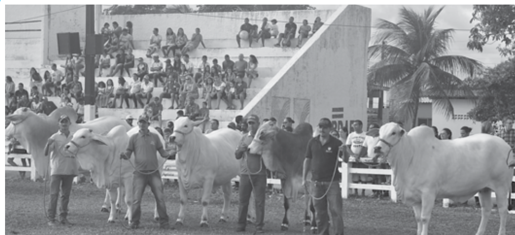
Animais Gir, Guzerá e Sindi geraram recursos da ordem R$ 265.000,00 uma média de R$ 6.500,00 por cabeça