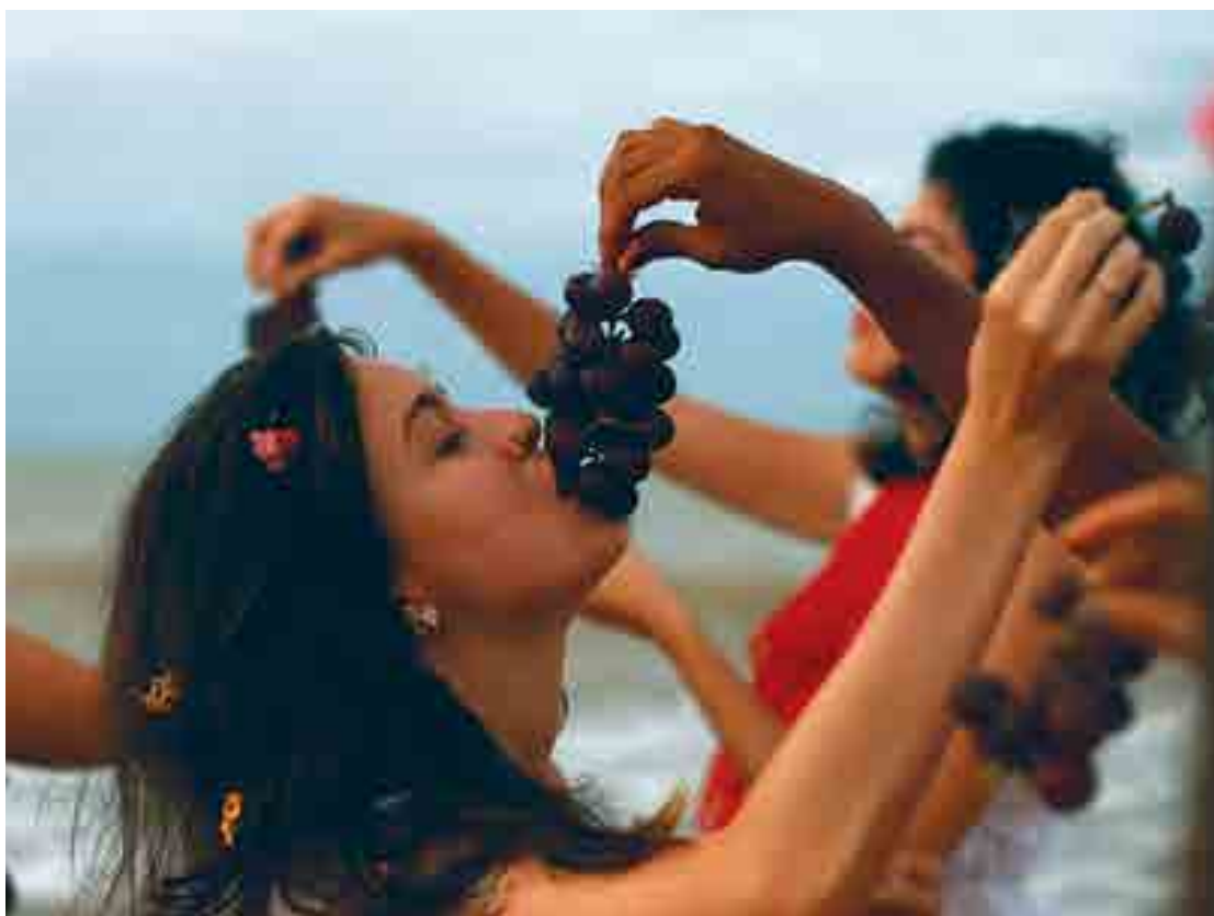
A performance do Evoé! é baseada nas obras literárias 'Outros jeitos de usar a boca', 'Fúcsia' e 'Eu; Mulher; Mulher'