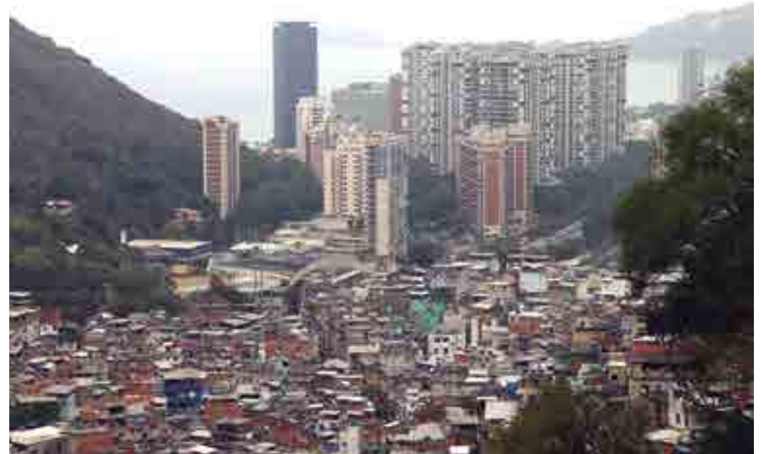
A violência se acirrou na Rocinha na última semana quando grupos rivais iniciaram um conflito armado pelo controle do território

Thomé disse que a situação de Rogério 157 é bastante “desconfortável” porque, além de estar sendo procurado pelas Forças