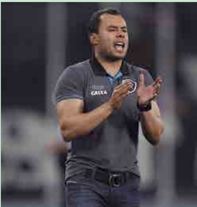
Jair Ventura se anima com o time, mas pede cautela sobre aspirações